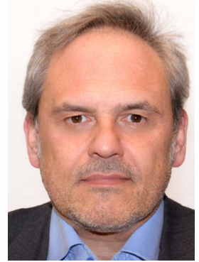
Expert informatique Formateur / Consultant

1, les Magnolias – 84300 CAVAILLON (France) Interventions France entière et étranger. email-cv@jacopini.fr +33 (0)6 19 71 79 12 Année de naissance : 1970 Identifiant Défense : 9084030052